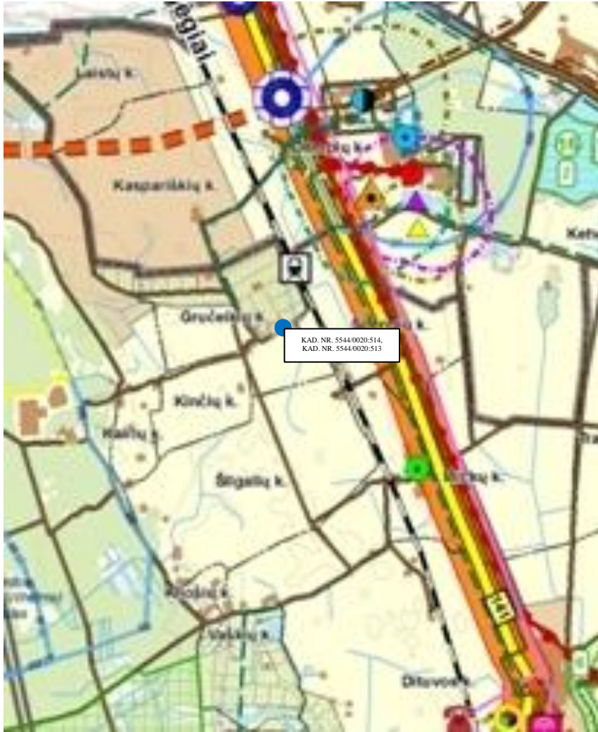
Ištrauka iš Bendrojo plano Teritorijos inžinerinės infrastruktūros ir susisiekimo brėžinio (reg. Nr. 003551003200).

Remiantis Bendrojo plano Teritorijos inžinerinės infrastruktūros ir susisiekimo brėžiniu į Gručiškių km., kur yra planuojama teritorija numatomas gamtinių dujų tiekimas – magistralinis dujotiekis.