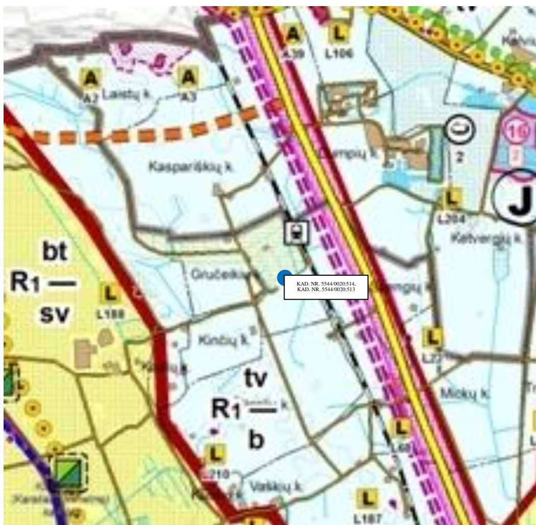
Ištrauka iš Bendrojo plano Rekreacijos, turizmo, gamtos ir kultūros paveldo plėtojimo brėžinio (reg. Nr. 003551003200).

Remiantis Bendrojo plano Rekreacijos, turizmo, gamtos ir kultūros paveldo plėtojimo brėžiniu planuojama teritorija yra sočių bendrijos teritorijoje .