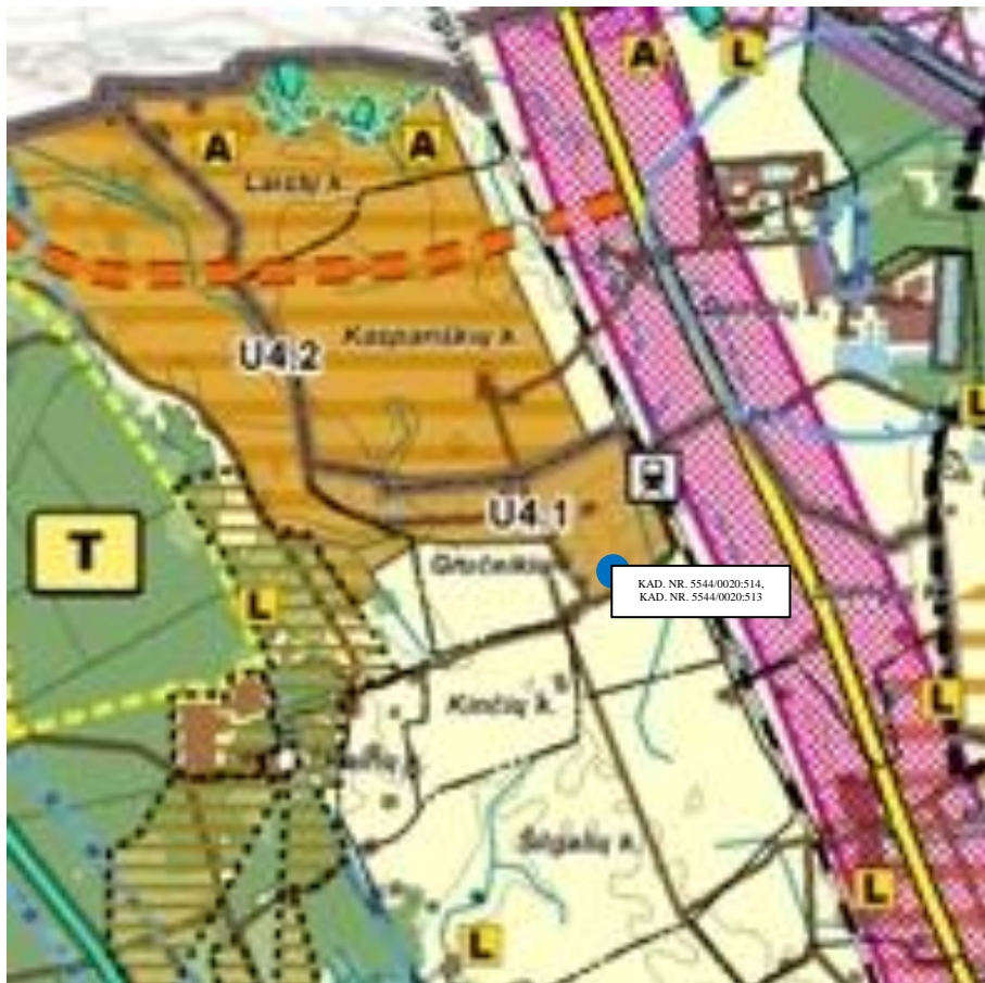
Ištrauka iš Bendrojo plano Gyvenamųjų vietovių tinklo ir socialinės infrastruktūros brėžinio (reg. Nr. 003551003200).

Remiantis Bendrojo plano Gyvenamųjų vietovių tinklo ir socialinės infrastruktūros brėžiniu planuojama teritorija yra kompaktiškoje urbanistinėje teritorijoje, kurioje numatyta U4.1 – ekstensyvaus (kompaktiško) užstatymo aplinka . Šalia planuojamos teritorijos yra I lygmens – I B kategorijos šalies urbanistinės integracijos ašys , tačiau planuojama teritorija nepatenka į šios ašies numatytą zoną. Netoli planuojamos teritorijos yra geležinkelio stotis.