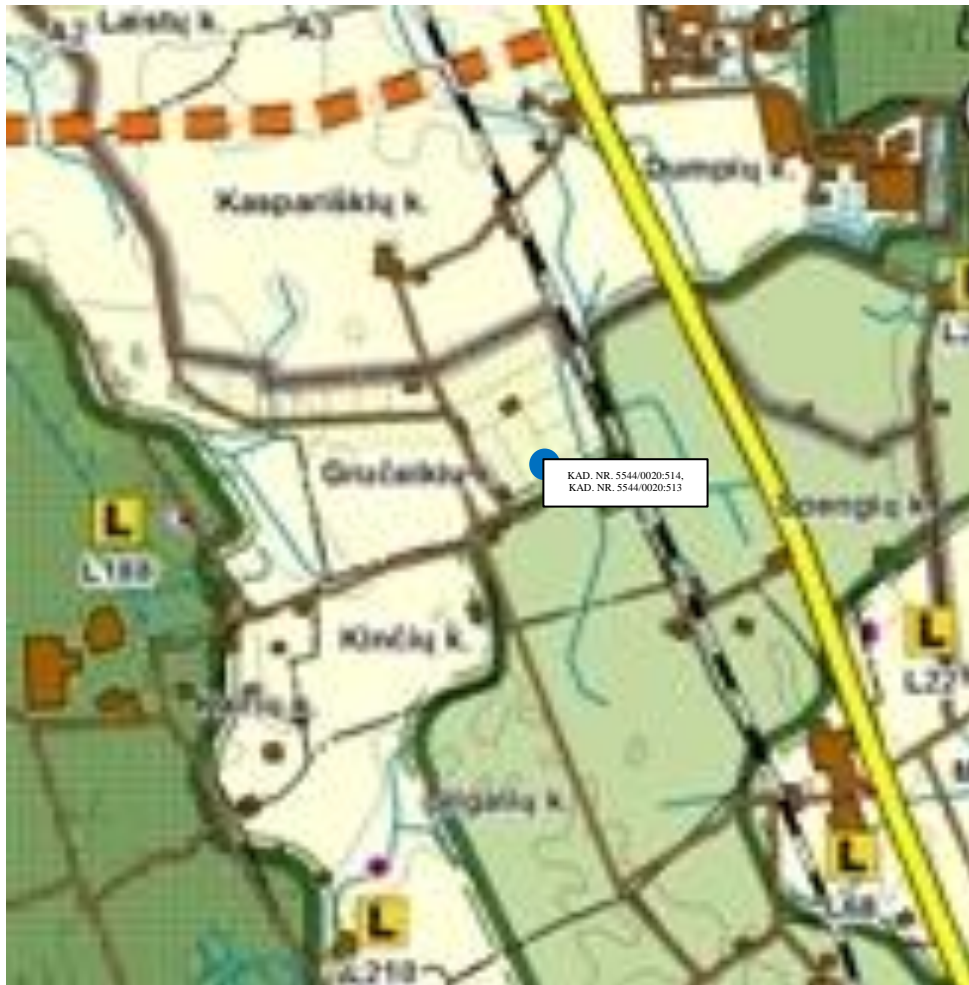
Ištrauka iš Bendrojo plano Gamtinio kraštovaizdžio, biologinės įvairovės, gamtos ir kultūros paveldo brėžinio (reg. Nr. 003551003200).

Remiantis Bendrojo plano Gamtinio kraštovaizdžio, biologinės įvairovės, gamtos ir kultūros paveldo brėžiniu planuojama teritorija yra sodų teritorijoje (sodų bendrijos teritorijoje) . Šalia sklypų yra vietinės svarbos gamtinio karkaso geokologinės takoskyros .