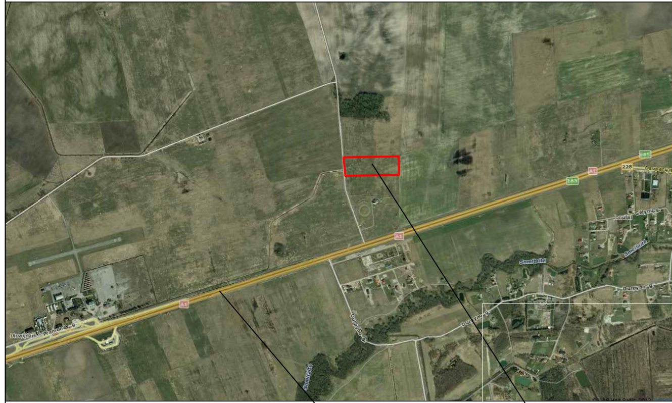
Ištrauka iš maps.lt žemėlapių

Magistralinis kelias Nr. A1 Vilnius-Kaunas-Klaipėda