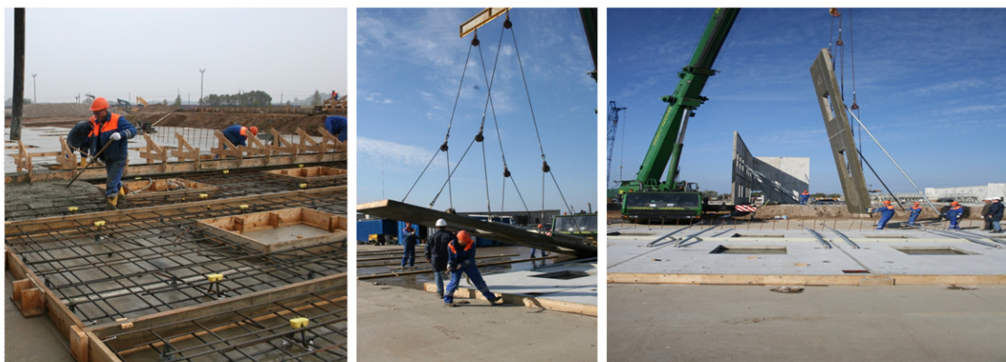
2 pav. Tilt-up statybos metodas

Bus naudojama įprastinė sandėliavimo statinių statybos technologija. Sandėliavimo statinių statybos sąlygos yra analogiškos Klaipėdos rajone statomų sandėliavimo statinių statybos sąlygoms, žr. 2 pav.