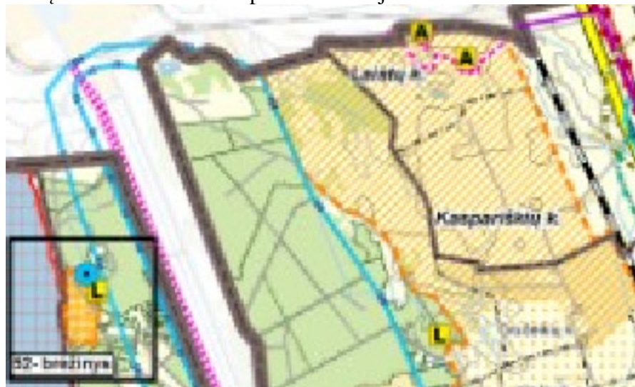
3 pav. Ištrauka iš Klaipėdos rajono vandens tiekimo ir nuotekų tvarkymo infrastruktūros plėtros specialiojo plano

Klaipėdos rajono vandens tiekimo ir nuotekų tvarkymo infrastruktūros plėtros specialiajame plane numatyta Kaspariškių, Laistų kaimuose vandentiekio ir nuotekų tvarkymo tinklus įrengti III-uoju plėtros etapu, parengus urbanistinės plėtros specialųjį planą. Plane numatyti gatvių infrastruktūrą su vandentiekio ir nuotekų tinklais urbanistinės plėtros teritorijose.