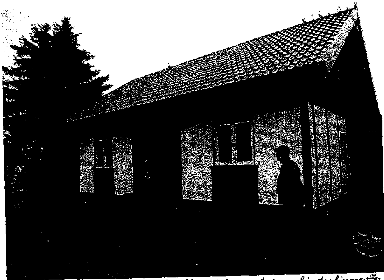
Siidlymas Sindulis bibliotekas is kelti j kitar patsalpon Sinduliuose priedu gaj