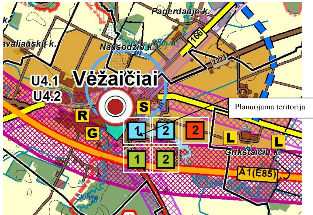
3 pav. Ištrauka iš Klaipėdos rajono bendrojo plano sprendinių. Gyvenamųjų vietovių tinklas ir socialinė infrastruktūra

Pagal bendrojo plano grafinės dalies gamtinio kraštovaizdžio, biologinės įvairovės, gamtos ir kultūros paveldo sprendinius, planuojamas sklypas patenka į gamtinio karkaso teritorija – migracijos koridorių (vietinės reikšmės), todėl būtina vadovautis Gamtinio karkaso nuostatais. Vadovaujantis nuostatų 10 punktu, gamtinio karkaso teritorijose, kurias bendrieji planai numato urbanizuoti (keisti paskirtį iš žemės ūkio į kitą), turi būti formuojamos tarpusavyje besijungiančios atskirųjų želdynų struktūros, sudarančios ne mažiau 50% teritorijos ploto. Rengiant detaliuosius tokių teritorijų planus, turi būti numatomas atskirų želdynų sklypų formavimas, t. y. želdynas esantis tik jam skirtame sklype. Atsižvelgiant į šias nuostatas, planuojamas sklypas yra dalinamas per pusę, į du atskirus sklypus, iš kurių vienas - formuojamas kaip atskiras želdynas. Todėl detaliojo plano sprendiniai neprieštarauja minėtoms nuostatomis ir bendrojo plano sprendiniams.