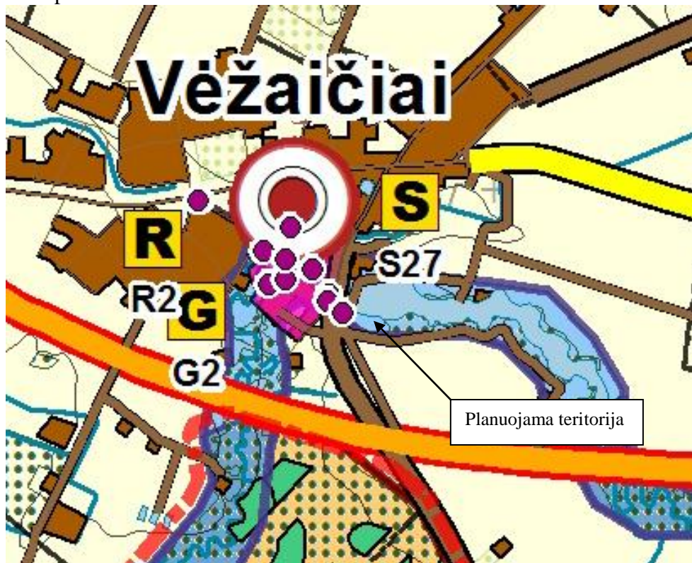
4 pav. Ištrauka iš Klaipėdos rajono bendrojo plano sprendinių. Gamtinis kraštovaizdis, biologinė įvairovė, gamtos ir kultūros paveldas

Pagal bendrojo plano grafinės dalies gamtinio kraštovaizdžio, biologinės įvairovės, gamtos ir kultūros paveldo sprendinius, planuojamas sklypas patenka į gamtinio karkaso teritorija – migracijos koridorių (vietinės reikšmės), todėl būtina vadovautis Gamtinio karkaso nuostatais. Vadovaujantis nuostatų 10 punktu, gamtinio karkaso teritorijose, kurias bendrieji planai numato urbanizuoti (keisti paskirtį iš žemės ūkio į kitą), turi būti formuojamos tarpusavyje besijungiančios atskirųjų želdynų struktūros, sudarančios ne mažiau 50% teritorijos ploto. Rengiant detaliuosius tokių teritorijų planus, turi būti numatomas atskirų želdynų sklypų formavimas, t. y. želdynas esantis tik jam skirtame sklype. Atsižvelgiant į šias nuostatas, planuojamas sklypas yra dalinamas per pusę, į du atskirus sklypus, iš kurių vienas - formuojamas kaip atskiras želdynas. Todėl detaliojo plano sprendiniai neprieštarauja minėtoms nuostatomis ir bendrojo plano sprendiniams.