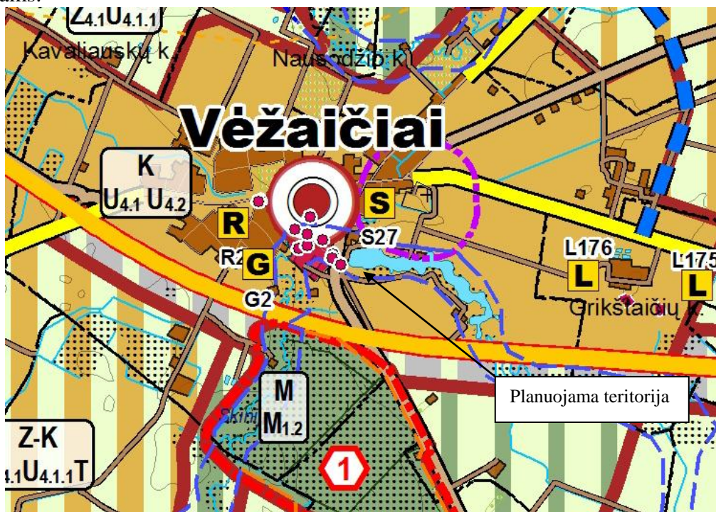
2 pav. Ištrauka iš Klaipėdos rajono bendrojo plano sprendinių

Pagal bendrojo plano gyvenamųjų vietovių tinklo ir socialinės infrastruktūros sprendinius planuojamas sklypas priskiriamas kitoms teritorijoms, t. y. kompaktiškos urbanistinės plėtros teritorijos, kuriose leidžiamas maksimalus užstatymas. Taip pat šalia planuojamo sklypo praeina urbanistinė integracijos ašis – I lygmens – I B kategorijos šalies urbanistinės integracijos ašis. Šie pateikti sprendiniai neprieštarauja detaliojo plano sprendiniams.