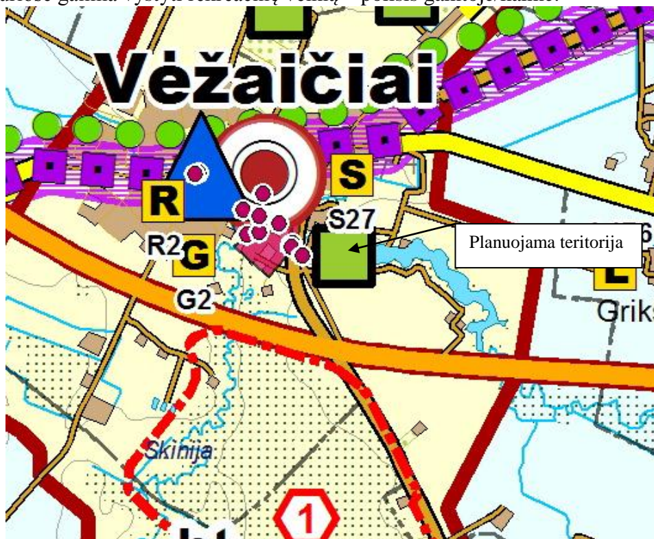
5 pav. Ištrauka iš Klaipėdos rajono bendrojo plano sprendinių. Rekreacijos, turizmo, gamtos ir kultūros paveldo plėtojimo brėžinys

Pagal bendrojo plano grafinės dalies rekreacijos, turizmo, gamtos ir kultūros paveldo plėtojimo brėžinį, planuojama teritorija, pagal centrų ir vietovių specializacija priskiriama prie teritorijų, kuriose galima vystyti rekreacinę veiklą – poilsis gamtoje/kaime.