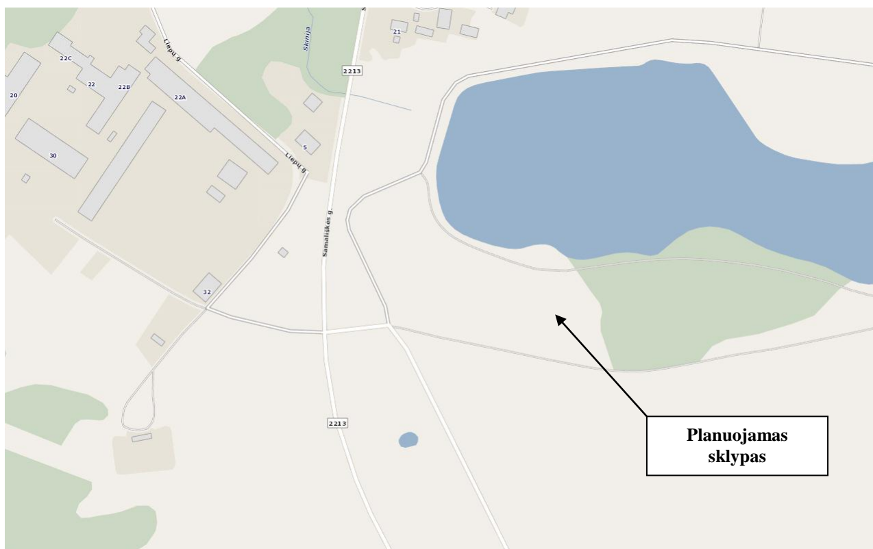
1 pav. Planuojamo sklypo vieta

Planuojamos teritorijos geografinės padėties aprašymas: Planuojamas sklypas yra Vėžaičių mstl., Klaipėdos rajone, šalia Vėžaičių užtvankos.