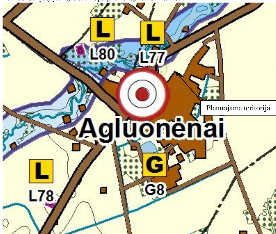
4 pav. Ištrauka iš Klaipėdos rajono bendrojo plano sprendinių. Gamtinis kraštovaizdis, biologinė įvairovė, gamtos ir kultūros paveldas

Pagal bendrojo plano grafinės dalies gamtinio kraštovaizdžio, biologinės įvairovės, gamtos ir kultūros paveldo sprendinius, planuojamas sklypas nepatenka į gamtinio karkaso teritorija, ar kitas zonas kurios darytų įtaką detaliojo plano sprendiniams.