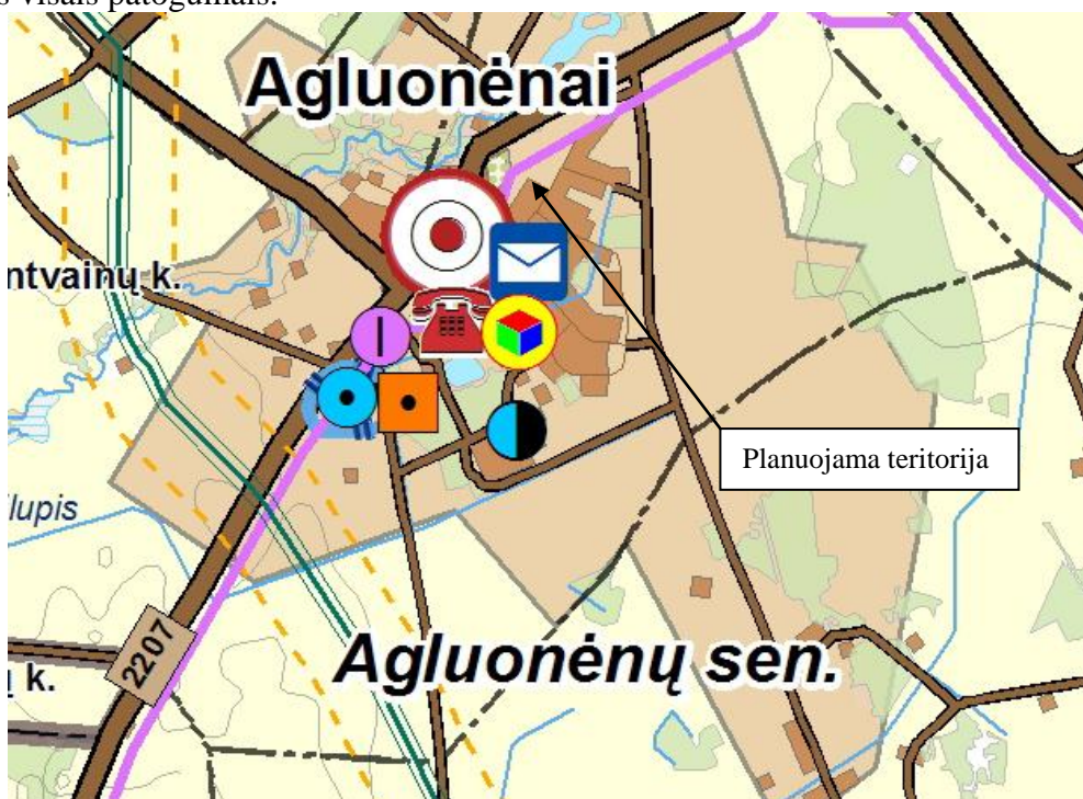
6 pav. Ištrauka iš Klaipėdos rajono bendrojo plano sprendinių. Teritorijos inžinerinės infrastruktūros ir susisiekimo brėžinys

Remiantis bendrojo plano grafines dalies teritorijos inžinerinės infrastruktūros ir susisiekimo brėžiniu sklypas yra šalia Agluonėnų gyvenvietės centro, todėl čia sparčiai plečiama inžinerinė infrastruktūra ir netolimoje ateityje planuojama teritorija taip pat įsilies į bendrą visumą ir naudosis visais patogumais.