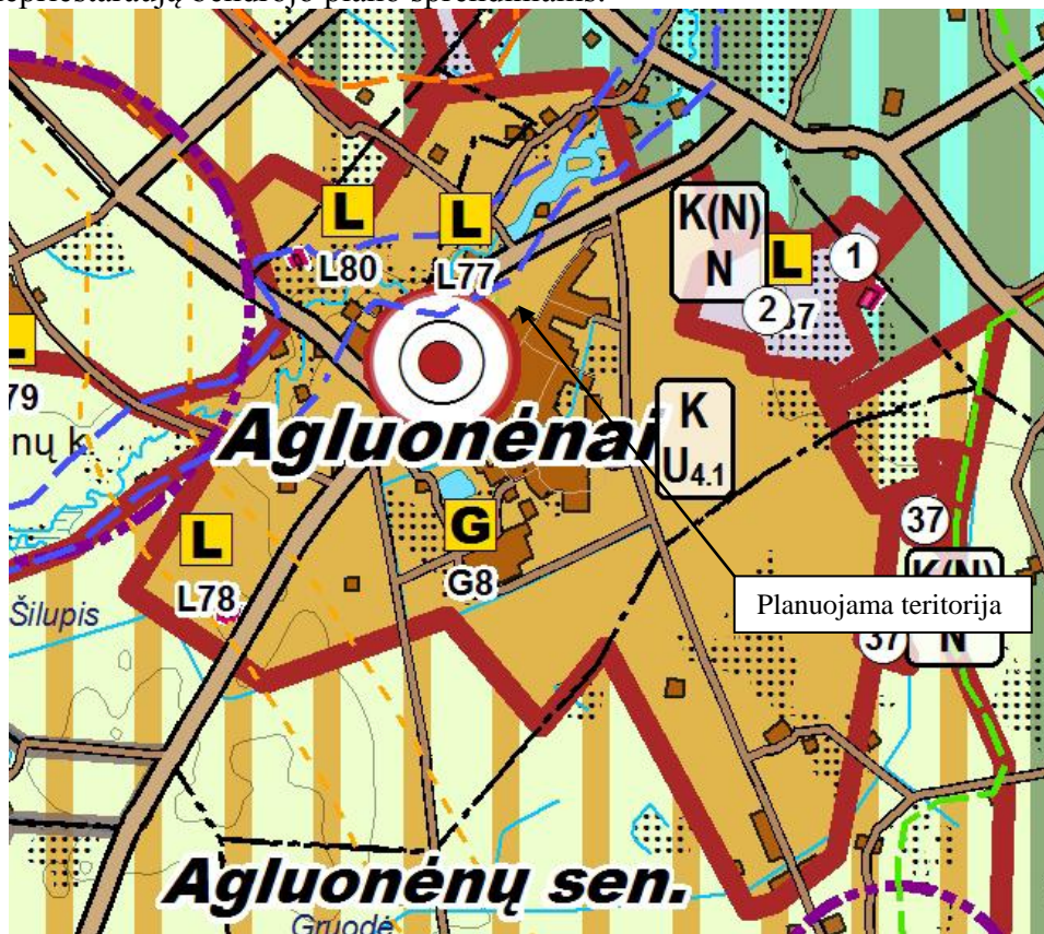
2 pav. Ištrauka iš Klaipėdos rajono bendrojo plano sprendinių

Detaliojo plano sprendinių atitikimas bendrojo plano sprendiniams: Pagal Klaipėdos rajono bendrojo plano sprendinius, planuojama teritorija patenka į zoną kurioje galima Kita paskirtis (K – prioritetinga paskirtis), t.y. bendrojo tvarkymo gyvenviečių ar jų dalių sklypai, šioje teritorijoje galioja – U4.1 (ekstensyvaus (kompaktiško) užstatymo) indeksas. Planuojamas sklypas bus tvarkomas pagal U4.1 reglamentą, todėl atsižvelgiant į bendrojo plano tekstinės dalies 5.6 punkte pateiktoje lentelėje 5.6.1 išdėstytus argumentus: „Šiai kategorijai priskiriamos esamų miestų, miestelių ir kaimų užstatytos bei kompaktiškos plėtros teritorijos ir jų dalys, kur vyrauja sodybinis ir mažaaukštis užstatymas, o taip pat atskiros sodybos ar jų grupės žemės ūkio paskirties teritorijose. Kompaktiškai užstatytose teritorijose prioritetas teikiamas kitai žemės naudojimo paskirčiai. Teritorijose, priskiriamose gamtiniam karkasui, prioritetas teikiamas želdynų formavimui, tame tarpe atskirųjų želdynų – kapinių. Leidžiamas ribotas užstatymo tankio ir aukštingumo didinimas, susiklosčiusios planinės struktūros transformavimas. Kompaktiško užstatymo teritorijose galimi visi kitos paskirties žemės naudojimo būdai ir pobūdžiai (t. t. komercinių, smulkaus ir vidutinio verslo gamybinių ir sandėliavimo objektų statyba), išskyrus daugiaaukščių pastatų statybą.“ Galima teigti, jog detaliojo plano tikslai bei sprendiniai visiškai atitinka ir neprieštarauja bendrojo plano sprendiniams.