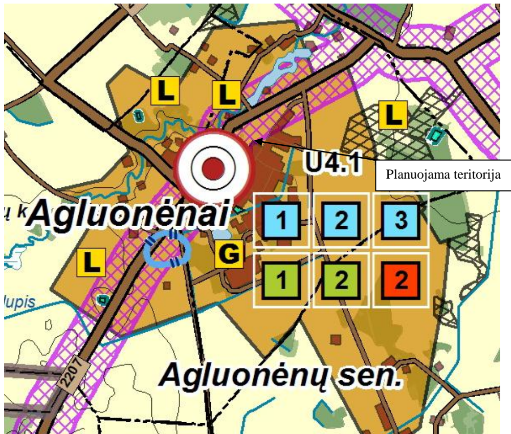
3 pav. Ištrauka iš Klaipėdos rajono bendrojo plano sprendinių. Gyvenamųjų vietovių tinklas ir socialinė infrastruktūra

Pagal bendrojo plano grafinės dalies gamtinio kraštovaizdžio, biologinės įvairovės, gamtos ir kultūros paveldo sprendinius, planuojamas sklypas nepatenka į gamtinio karkaso teritorija, ar kitas zonas kurios darytų įtaką detaliojo plano sprendiniams.