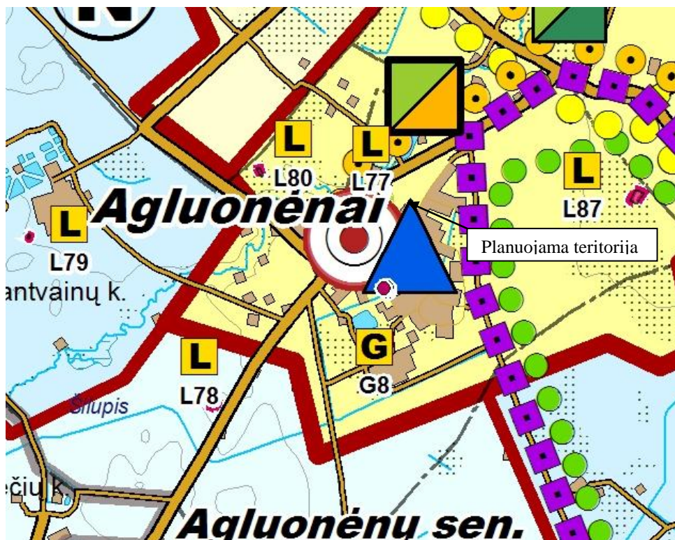
5 pav. Ištrauka iš Klaipėdos rajono bendrojo plano sprendinių. Rekreacijos, turizmo, gamtos ir kultūros paveldo plėtojimo brėžinys

bendrasis rekreacinis potencialas vidutinis. Todėl ši teritorija nėra patraukli užsiimti rekreaciniais veiklais.