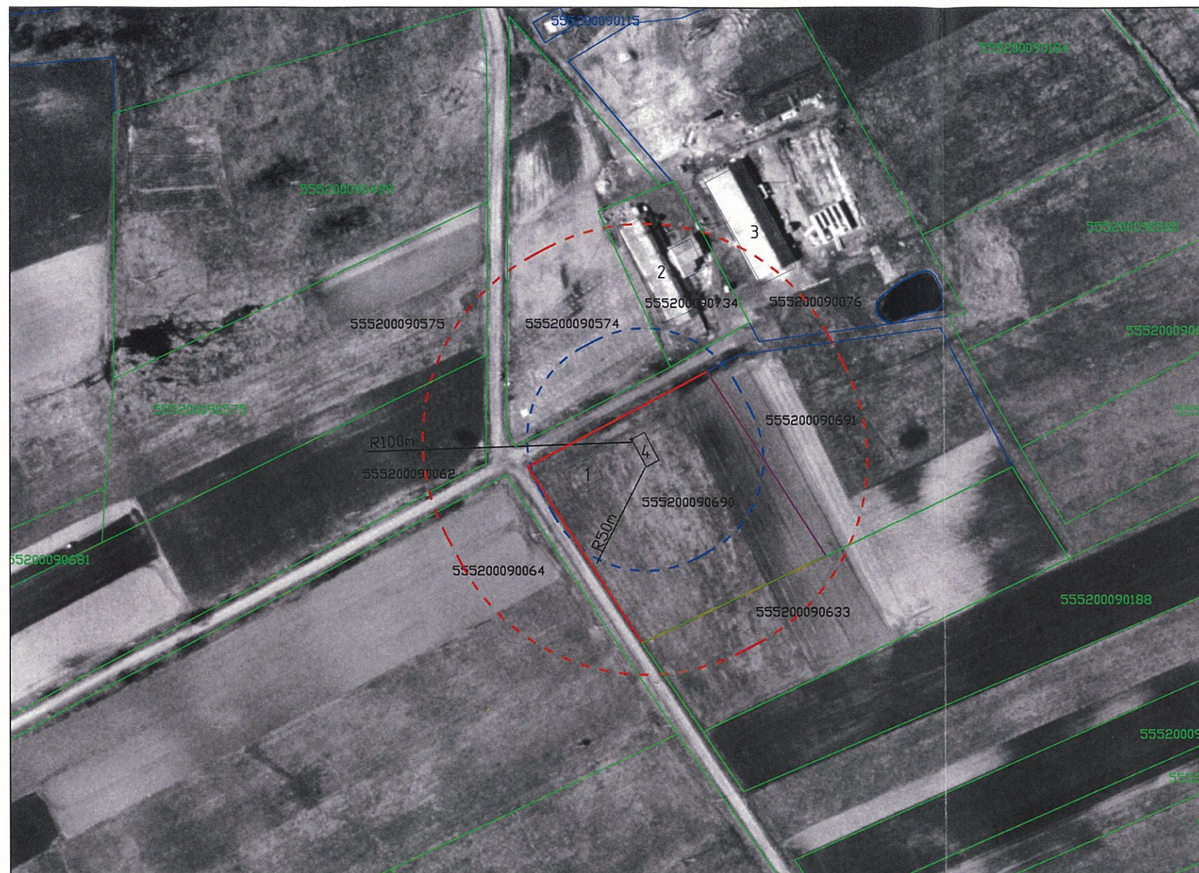
SANITARINIŲ APSAUGOS ZONŲ RIBŲ DYDŽIAI, TAIKOMI, KAI NEATLIEKAMAS POVEIKIO VISUOMENĖS SVEIKATAI VERTINIMAS