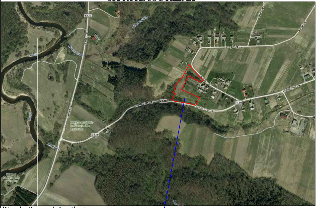
Ištrauka iš maps.lt žemėlapiu Planuojama teritorija