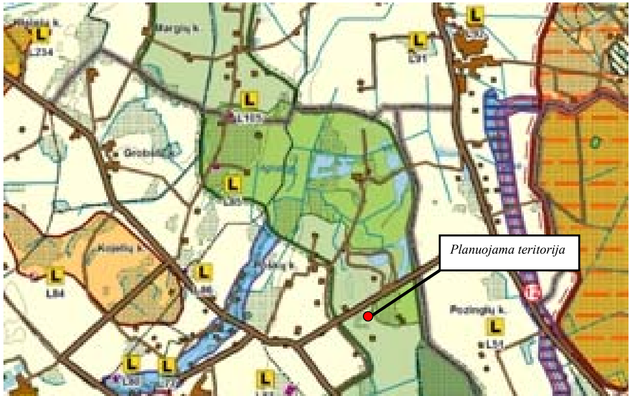
Ištrauka iš Klaipėdos rajono bendrojo plano sprendinių Gamtinis kraštovaizdis, biologinė įvairovė, gamtos ir kultūros paveldas (3 brėžinys)

ir gausinti kraštovaizdžio natūralumą atkuriančius elementus.