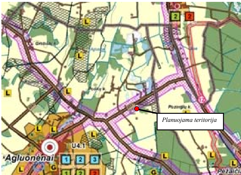
Ištrauka iš Klaipėdos rajono bendrojo plano sprendinių Gyvenamųjų vietovių tinklas ir socialinė infrastruktūra (2 brėžinys)

Pagal Klaipėdos rajono bendrojo plano sprendinius „Gyvenamųjų vietovių tinklas ir socialinė infrastruktūra“ planuojama teritorija patenka į IV lygmens lokaliųjų jungčių teritorijas.