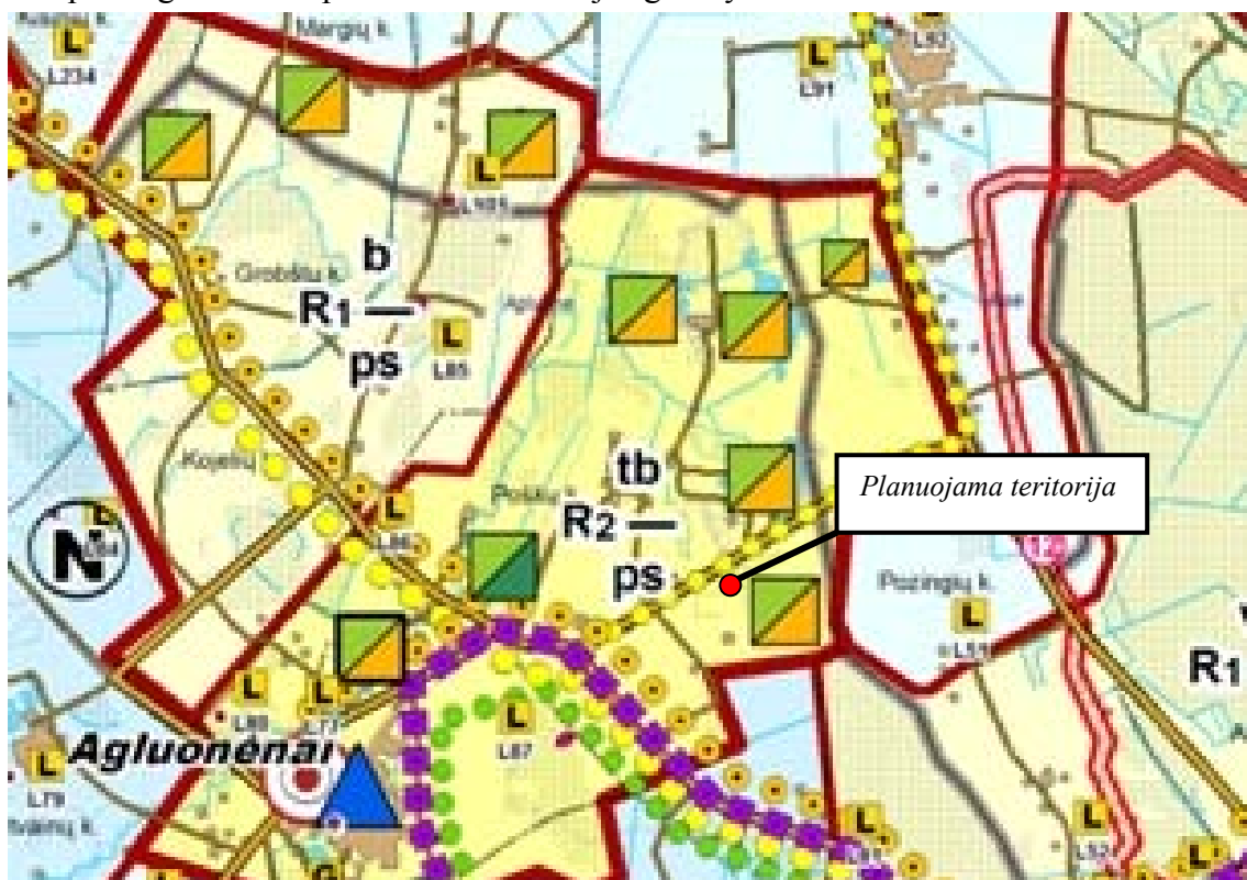
Ištrauka iš Klaipėdos rajono bendrojo plano sprendinių Rekreacijos, turizmo, gamtos ir kultūros paveldo plėtojimo brėžinys (4 brėžinys)

Pagal Klaipėdos rajono bendrojo plano sprendinius „Rekreacijos, turizmo, gamtos ir kultūros paveldo plėtojimo brėžinys“ planuojama teritorija patenka į vidutinio rekreacijos vystymo lygmens teritoriją, kur numatoma prioritetinga rekreacijos vystymo kryptis yra bendroji ir pažintinė rekreacija su numatoma pramoginėmis ir sportinėmis rekreacijos galimybėmis.