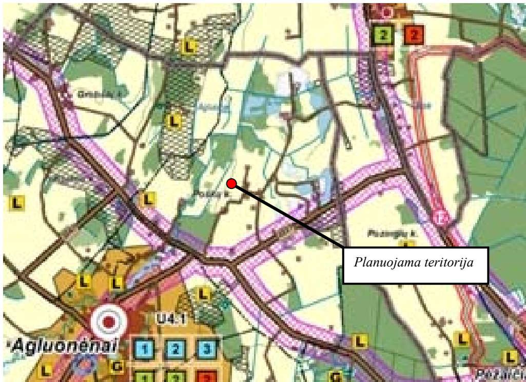
Ištrauka iš Klaipėdos rajono bendrojo plano sprendinių Gyvenamųjų vietovių tinklas ir socialinė infrastruktūra (2 brėžinys)

Pagal Klaipėdos rajono bendrojo plano sprendinius „Gyvenamųjų vietovių tinklas ir socialinė infrastruktūra“ planuojama teritorija nepatenka į jokiais saugojamas teritorijas. Bendrajame plane nurodoma, kad šalia planuojamos teritorijos yra eksploatuojami naudingųjų iškasenų telkiniai.