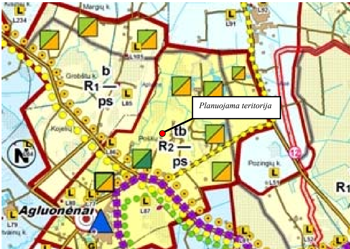
Ištrauka iš Klaipėdos rajono bendrojo plano sprendinių Rekreacijos, turizmo, gamtos ir kultūros paveldo plėtojimo brėžinys (4 brėžinys)

Pagal Klaipėdos rajono bendrojo plano sprendinių „Teritorijos inžinerinės infrastruktūros ir susisiekimo brėžinys“ planuojama teritorija patenka į žemės ūkio teritoriją, kur nenumatoma perspektyvoje jokių inžinerinių tinklų.