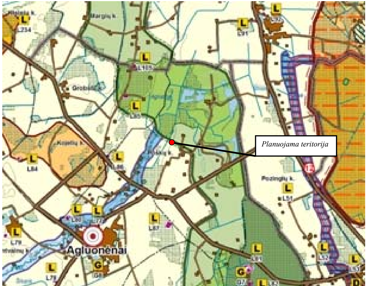
Ištrauka iš Klaipėdos rajono bendrojo plano sprendinių Gamtinis kraštovaizdis, biologinė įvairovė, gamtos ir kultūros paveldas (3 brėžinys)

Pagal Klaipėdos rajono bendrojo plano sprendinius „Gamtinis kraštovaizdis, biologinė įvairovė, gamtos ir kultūros paveldas“ dalis planuojamos teritorijos patenka į rajoninės svarbos geokologinės takoskyros teritoriją, kurioje numatyti gražinami ir gausinami kraštovaizdžio natūralumą atkuriantys elementai. Aplink šią teritoriją numatoma naudingųjų iškasenų, karjerų plėtra, nes ši teritorija detaliai išžvalgyta kaip galimos naudingųjų iškasenų teritorijos. Jas išekspluotavus, numatoma, kad šios teritorijos ateityje tenkins žmonių rekreacinius poreikius. Planuojamoje teritorijoje nėra saugomų gamtos vertybių sąrašė įrašytų objektų.